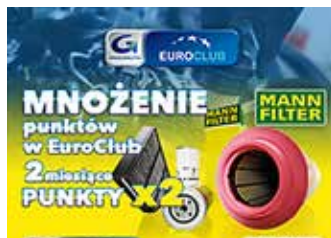
Mnożenie w EuroClub z MANN FILTER - 2 miesiące punkty x 2