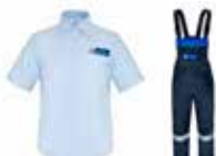
Odzież biurowa i robocza

Promocyjny program Euro Club jest skierowany wyłącznie do warsztatów zrzeszonych w sieci EuroWarsztat. Zakupy wybranych produktów u regionalnych Dystrybutorów Groupauto Polska są premiowane punktami EuroClub, które co kwartał kumulują się na indywidualnych kontach EuroWarsztatów. Punkty wymieniamy na nagrody!