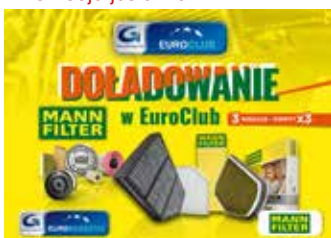
Mnożenie w EuroClub z MANN FILTER - 3 miesiące punkty x 3