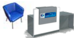
Meble do biura obsługi klienta