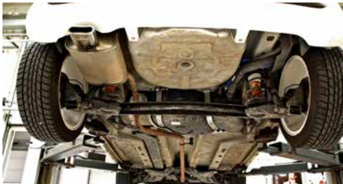
Z tyłu – belka podatna na skręcanie, wzmocniona stabilizatorem. Taka konstrukcja jest wyjątkowo wytrzymała.

mylą. Aby to sprawdzić, sprawdzaliśmy katalogi części. Między Pandą a Fiatem 500 widać pewne rozbieżności. Różnią się np. numery wahaczy a także numery łączników stabilizatora. Te w 500 przypominają raczej stosowane w większych modelach Bravo, Stilo i Lancii Delta III. Niewspółzamiennie z Pandą są także amortyzatory. Większość części zawieszenia jest natomiast taka sama jak w produkowanym na tej samej linii Fordem Ka.