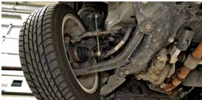
Z przodu klasyczny układ McPherson. Zawieszenie jest zatem dość proste konstrukcyjnie i przez to tanie w serwisowaniu.