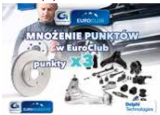
Mnożenie w EuroClub z DELPHI - punkty x 3