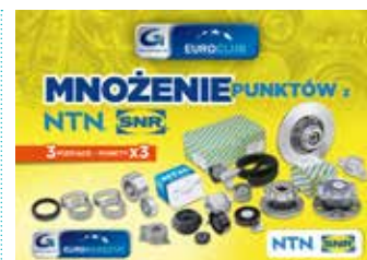
Mnożenie w EuroClub z NTN-SNR 3 miesiące punkty x 3