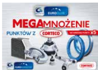
Mnożenie w EuroClub Punkty z Corteco x 5