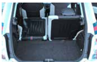
Bagażnik ma pojemność 185 litrów, czyli niewiele więcej niż Seicento.