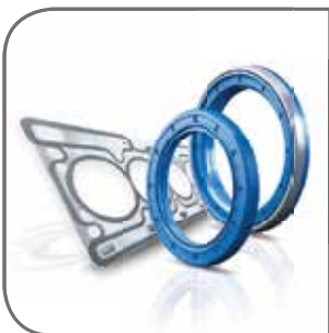
FREUDENBERG SEALING TECHNOLOGIES

PONAD 26.000 CZĘŚCI NA MOTORYZACYJNYM NIEZALEŻNYM RYNKU WTÓRNYM.