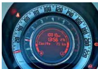
Oryginalne zegary. Obrotomierz znalazł się wewnątrz prędkościomierza.