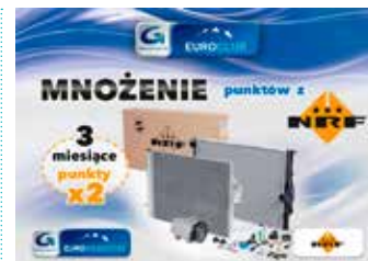
Mnożenie w EuroClub z NRF punkty x 2